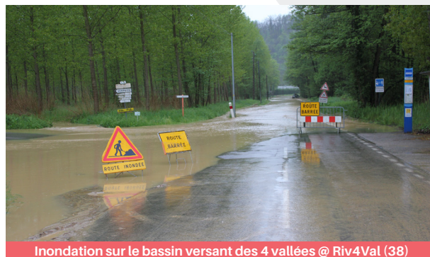
Inondation sur le bassin versant des 4 vallées @ Riv4Val (38)

Inscriptions en ligne jusqu'au 23/01/2020 sur : https://forms.gle/8dZnTM25HuzwQJ7HA